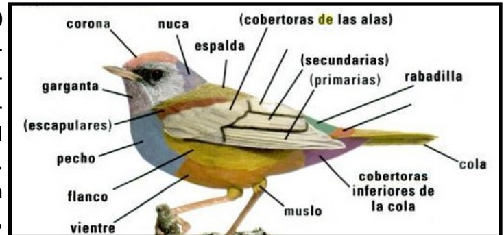
Partes de un ave (Kaufman, 2005).

La observación de aves esta entre los pasatiempos mas placenteros en el mundo. En Norteamérica existen mas de 700 tipos de aves. Las aves se pueden encontrar tanto en ambientes urbanos como en hábitats naturales, dependiendo del área será la diversidad de éstas. Por lo general, se encuentran activas a muy tempranas horas, a veces a medio día y al atardecer. Sin embargo, en invierno la actividad de estos animales es constante durante todo el dia. Por la tanto, la diversidad de aves también cambia con las estacione del año. Cuando se encuentran anidando y criando (principalmente en primavera y verano) la mayoría de las especies están separadas en pares paraa defender los pequeños territorios. Sin embargo, en las demás temporadas pueden encontrarse en parvadas mixtas con diferentes especies. i